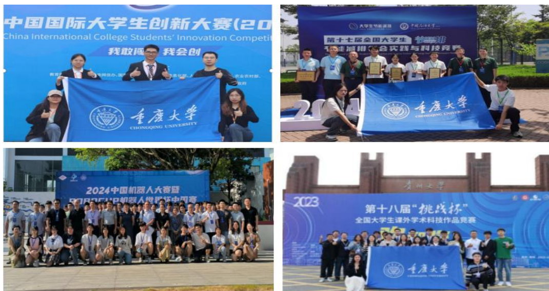
图6 学生参加各类竞赛