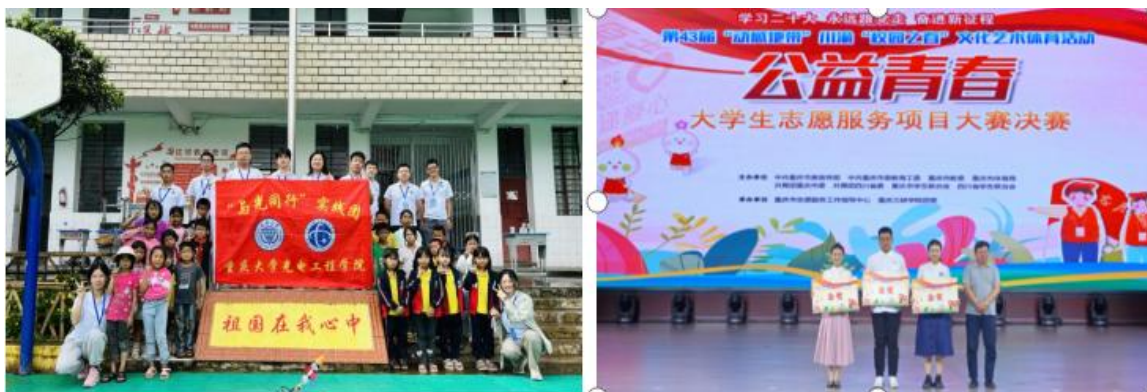
图 8 学生参加社会实践活动