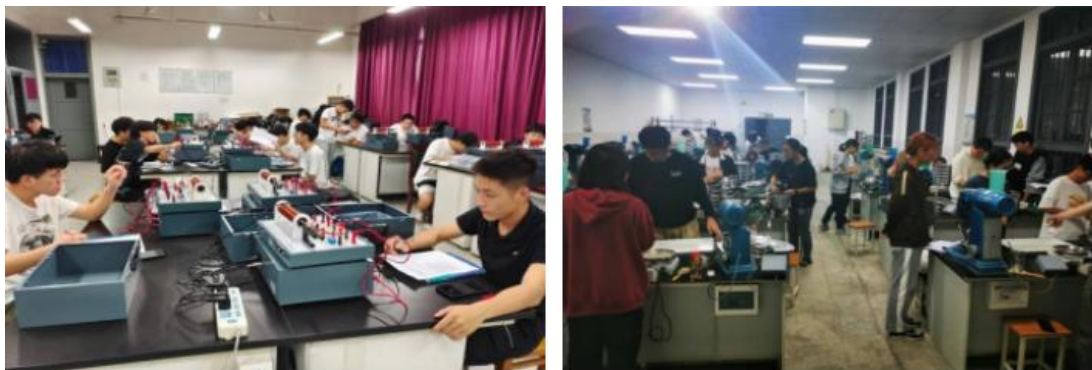
图 3 学生实验现场

本学年全校开设各类实验课程 800 余门，其中独立设置的专业实验课程 221 门。实验教学总人时数 205 万，新增或改革实验课程 60 余门，新增或改革实验项目 160 余个，实验项目总数超 3000 个，创新性、设计性、综合性实验内容持续增加。