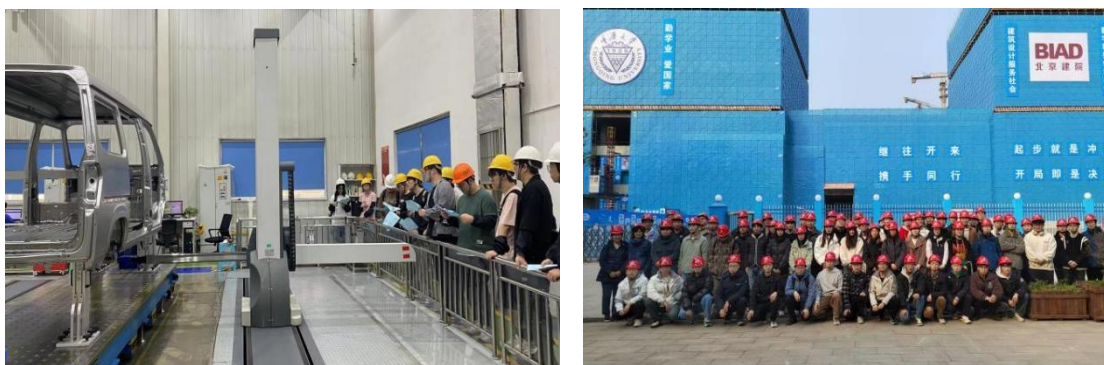
图 4 学生实习现场

加强实习教学管理，现有校外实习基地 500 余个。本学年学生实习人次近 3 万人次，其中集中实习占全校实习总人次数的 87.5%，现场实习占 98.7%，重庆市内实习占 87.0%。