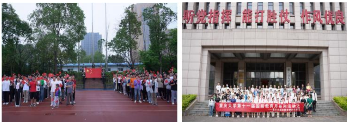
图 7 学校开展爱国主义教育