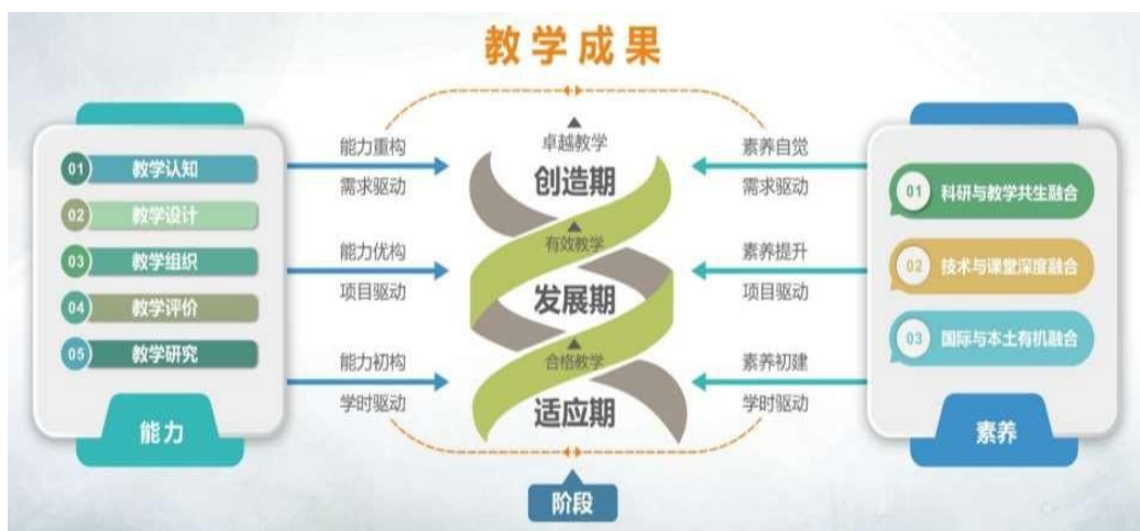
图1 教师教学能力发展“533”模式

分层分类追求卓越。 实施“双证上讲台”（高校教师资格证+主讲教师资格认定）的新教师成长计划，以“培训+演练+体验”的方式帮助新教师掌握教学基本方法，具备教学基本能力；通过教师教学能力提升研修班帮助教学副院长、系主任、专业负责人更新教学理念，拓宽教育视野，提升卓越教学能力；通过教学技能工作坊（ISW/FDW/TDW）三级培训体系助推培训师队伍快速成长。通过教改培育、竞赛指导、学习发展的“三阶段”竞赛组织机制实现了以赛促教、以赛促学的实际落地。本学年，学校教师在全国性教学比赛中获奖 20 项，省部级教学比赛中获奖 44 项。