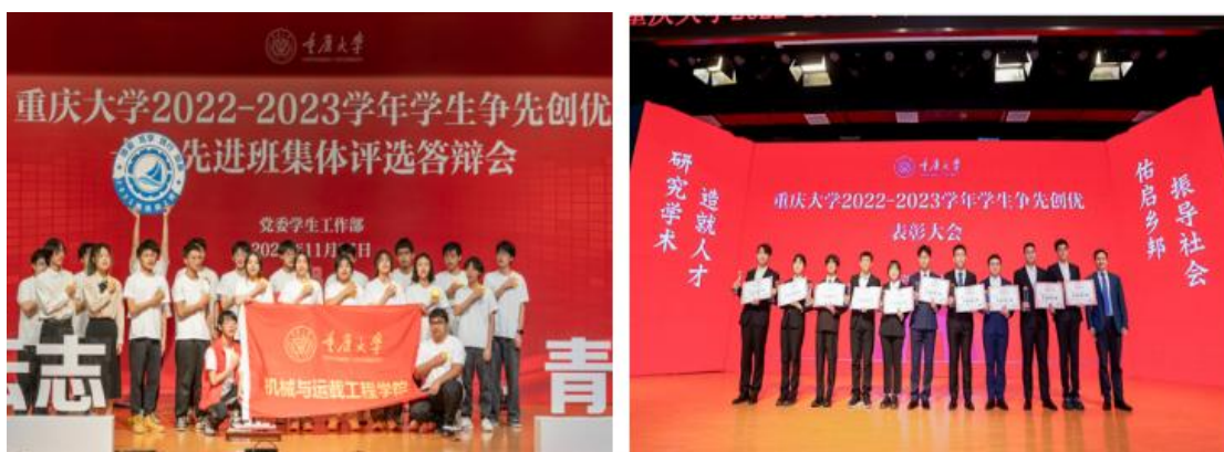
图 9 学生“争先创优”评选表彰现场

建立学风建设长效机制，激发学生学习内生动力。树品牌，实施“晨曦计划”，开展学生年度人物经验分享会、名师讲堂、朋辈答疑坊、研途有你等学业指导活动；开展学生宿舍党建引领、宿舍文化、文明寝室创建等主题宣传展示活动，培塑学生良好行为习惯。体教融合，持续实施“健康重大人行动计划”，开展“阳光 60 分”健康行、“重大杯”足球赛、篮球赛、本科生体测技能大赛等体育活动，培养学生常态化锻炼习惯。学生体测合格率 94.12%。选标杆，凝聚榜样力量，评选优秀学生综合奖学金 13893 人，评选表彰“争先创优”先进个人 5394 名、先进集体 332 个；获评重庆市高校学生先进个人 271 名、先进班集体 9 个。